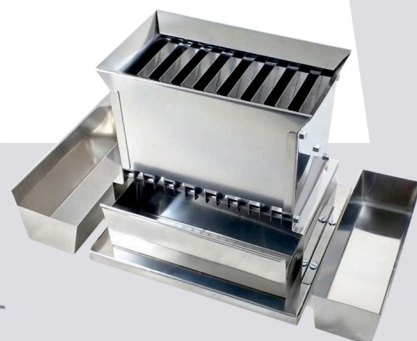
QUARTEADOR DE AMOSTRAS