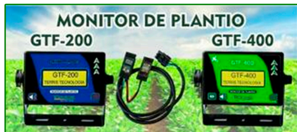
MONITOR DE PLANTIO