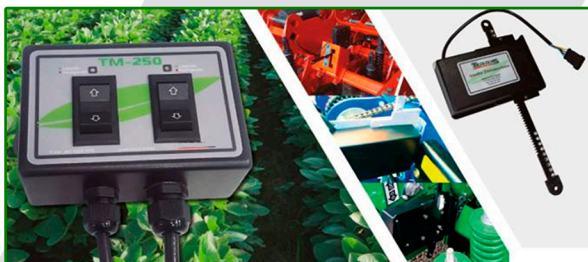
CATRACA PARA CORTE DE SESSÃO PLANTADEIRA