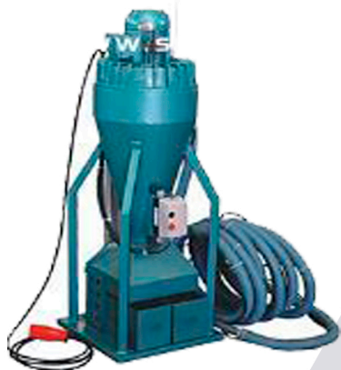
COLETOR DE AMOSTRAS PNEUMÁTICO